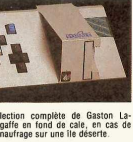
lection complète de Gaston LAURENGER en fond de cale, en cas de naufrage sur une île déserte.

veau ! ! ! 92 k de mémoire bien vivante (utilisateur), plus 4 K de mémoire déjà morte pour le monteur. En y regardant de plus près, vous constatez que 32 k sont réservés à l'affichage graphique. C'est beaucoup, mais le squala est capable de générer des dessins impossibles, d'une résolution de 256 points par 256 points, avec 16 vraies couleurs par point. On peut mélanger textes et graphiques sans problèmes. Ca vous fait bien plaisir, parce que vous êtes un fan de bandes dessinées. D'ailleurs vous avez la col-